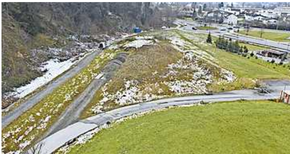
Im Bereich Kobel soll das Altstoffsammelzentrum Mittleres Rheintal entstehen.