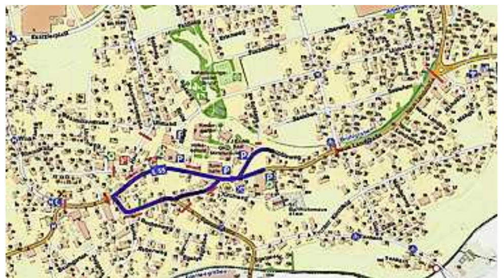
Blau: Umzugsweg | Rot: Straßensperren

Wir bitten die Bewohner dieser Gebiete, ihre Fahrzeuge, falls diese an diesem Nachmittag benötigt werden, rechtzeitig an einer anderen Stelle zu parken. Nach dem Umzug und nach der Reinigung werden die Straßen wieder freigegeben. Wir bitten euch eventuelle Unannehmlichkeiten zu entschuldigen.