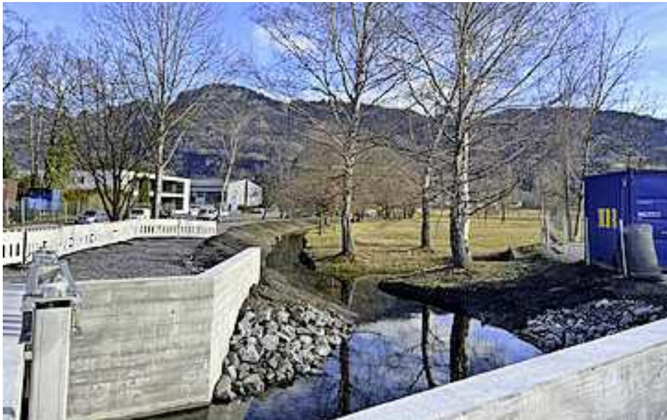
Im Laufe des März wird der erhöhte Radweg entlang der L 57 asphaltiert.

Für den kontrollierten Abfluss des Güllbachs in Richtung Altsch wurde an der