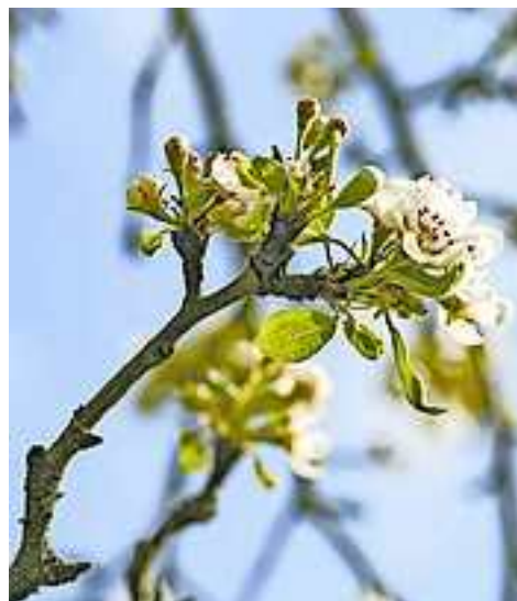
Feuerbrand ist meldepflichtig!

Jede befallene Pflanze enthält – teils über viele Jahre hinweg – Feuerbrand-Bakterien und birgt somit das Risiko, zahlreiche Pflanzen in ihrer Umgebung anzustecken. Sind die Bakterien in eine Pflanze eingedrungen, können sie nur noch durch Entfernung der befallenen Pflanzenteile, notfalls der ganzen Pflanze, wieder entfernt werden. Um den Feuerbrand einzudämmen, ist es erforderlich, möglichst viele von Feuerbrand befallene Pflanzen aufzufinden und die Infektionsstellen rasch zu beseitigen. Je rascher dies geschieht, desto besser ist die Chance, erkrankte Obstgehölze noch zu erhalten.