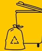
GELBE TONNE & GELBER SACK