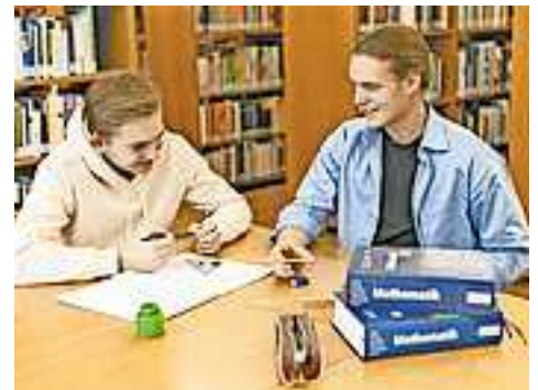
Alle Details gibt es unter www.aha.or.at/nachhilfe

Gleichzeitig können alle, die ihr Wissen teilen möchten, ihre Angebote kostenlos in der Plattform eintragen. Wer sich lieber Unterstützung bei einem professionellen Nachhilfeeinstituten holt, bekommt bei zahlreichen Anbietern eine Ermäßigung mit der „aha card“.