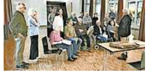
Weitere Infos unter www.selbsthilfe-vorarlberg.at oder www.aphasie.org

Das Team des „d'Hock“ organisiert am ersten Donnerstag des Monats zwischen 15 und 17 Uhr einen Hock im Café Mathildas, Lustenauer Straße 8, in Dornbirn. Kontakt: Tel. 0650/5317133 oder E-Mail ru-thurnher@web.de