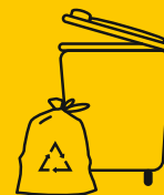
GELBE TONNE & GELBER SACK