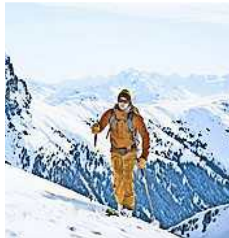
Am Ende ist das Ziel einer jeden Tour nicht der Gipfel, sondern wieder gesund zu Hause anzukommen.