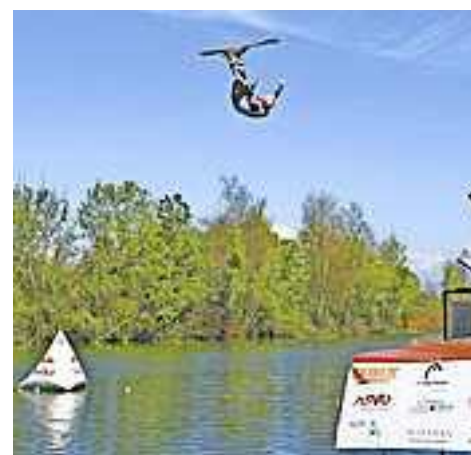
Schauen Sie vorbei und fiebern Sie mit!

Qualifikation ist von 12.30 bis 14 Uhr, das Finale erfolgt von 15 bis 16 Uhr. Die Siegerehrung und Tombola sind für 16.30 Uhr angesetzt.