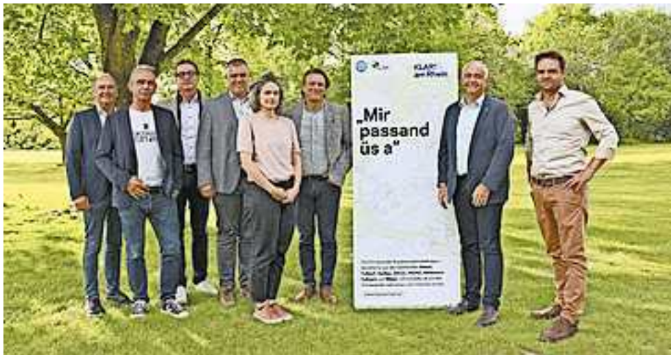
Die Vertreter der Gemeinden bei der Auftaktveranstaltung im Erholungszentrum Rheinauen.

Die acht Vorarlberger Rheintalgemeinden Altach, Fußach, Gaißau, Götzis, Höchst, Hohenems, Koblach und Mäder haben sich als „KLAR! am Rhein“ zusammengeschlossen. Der Klima- und Energiefonds unterstützt die Region mit dem Förderprogramm „Klimawandel-Anpassungsmodell-Region“ (KLAR!) dabei, sich frühzeitig auf die Herausforderungen des Klimawandels einzustellen – mit dem Ziel Schäden zu vermindern und die sich ergebenden Chancen zu nutzen.