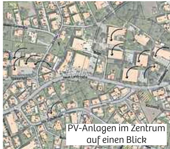
PV-Anlagen im Zentrum auf einen Blick

Die Gemeinde Mäder hat sich im Frühjahr 2023 auf den Weg zur „+Sonnenenergiegemeinde 2030“ gemacht. Durch einen systematischen Ausbau von PV-Anlagen auf den eigenen Gebäuden soll bis 2030 bilanziell mehr Sonnenstrom produziert werden, als in allen gemeindeeigenen Gebäuden und Infrastrukturanlagen verbraucht wird. Mit Stand Ende 2023 kann bereits mehr als 55% des Strombedarfs durch die PV-Anlagen erzeugt werden.