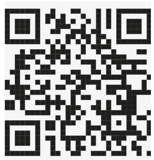
weitere Fotos auf unserer Homepage