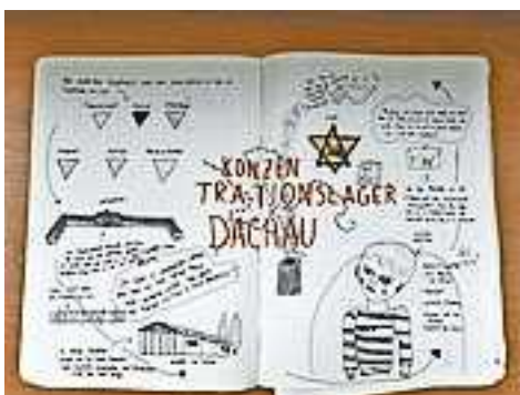
Zeichnung: Max Herda, 4a

sich diese schrecklichen Ereignisse niemals wiederholen und sind im Kontext der Erinnerungskultur unerlässlich.