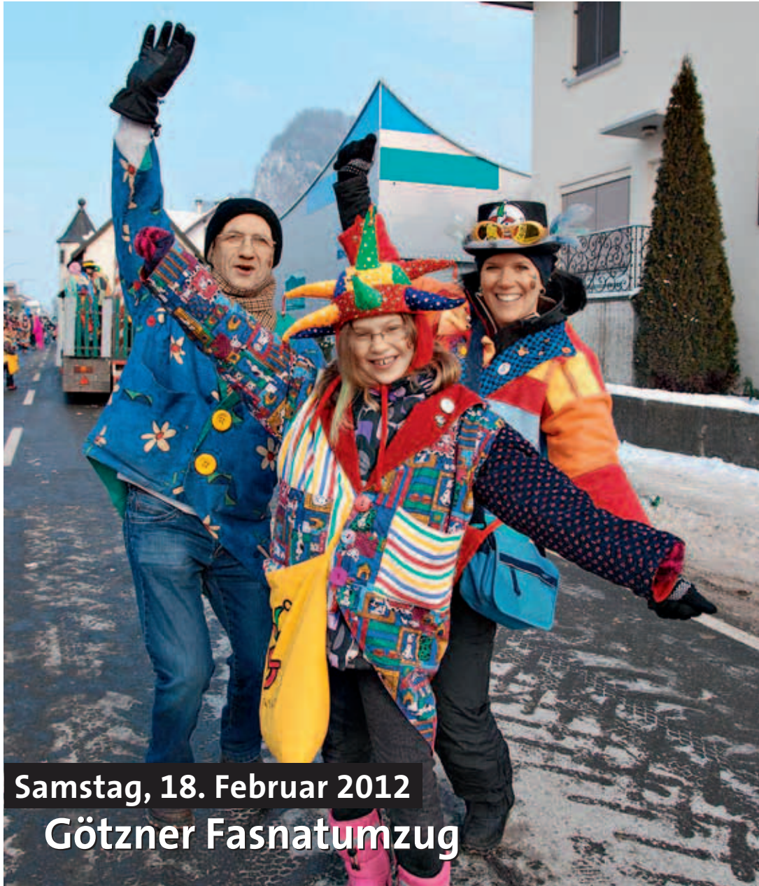
Samstag, 18. Februar 2012 Götzner Fasnatumzug

Amts- und Anzeigenblatt der Gemeinden Hohenems, Götzis, Altach, Koblach und Mäder Erscheinungsort und Verlagspostamt, 6845 Hohenems Einzelpreis € 0,45