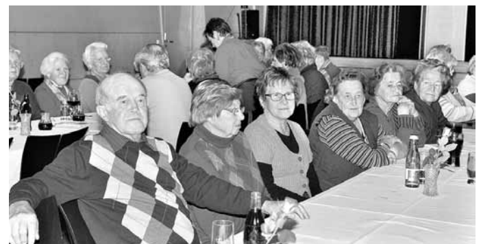
Gespannt warten die Teilnehmer auf die Filmvorführung.